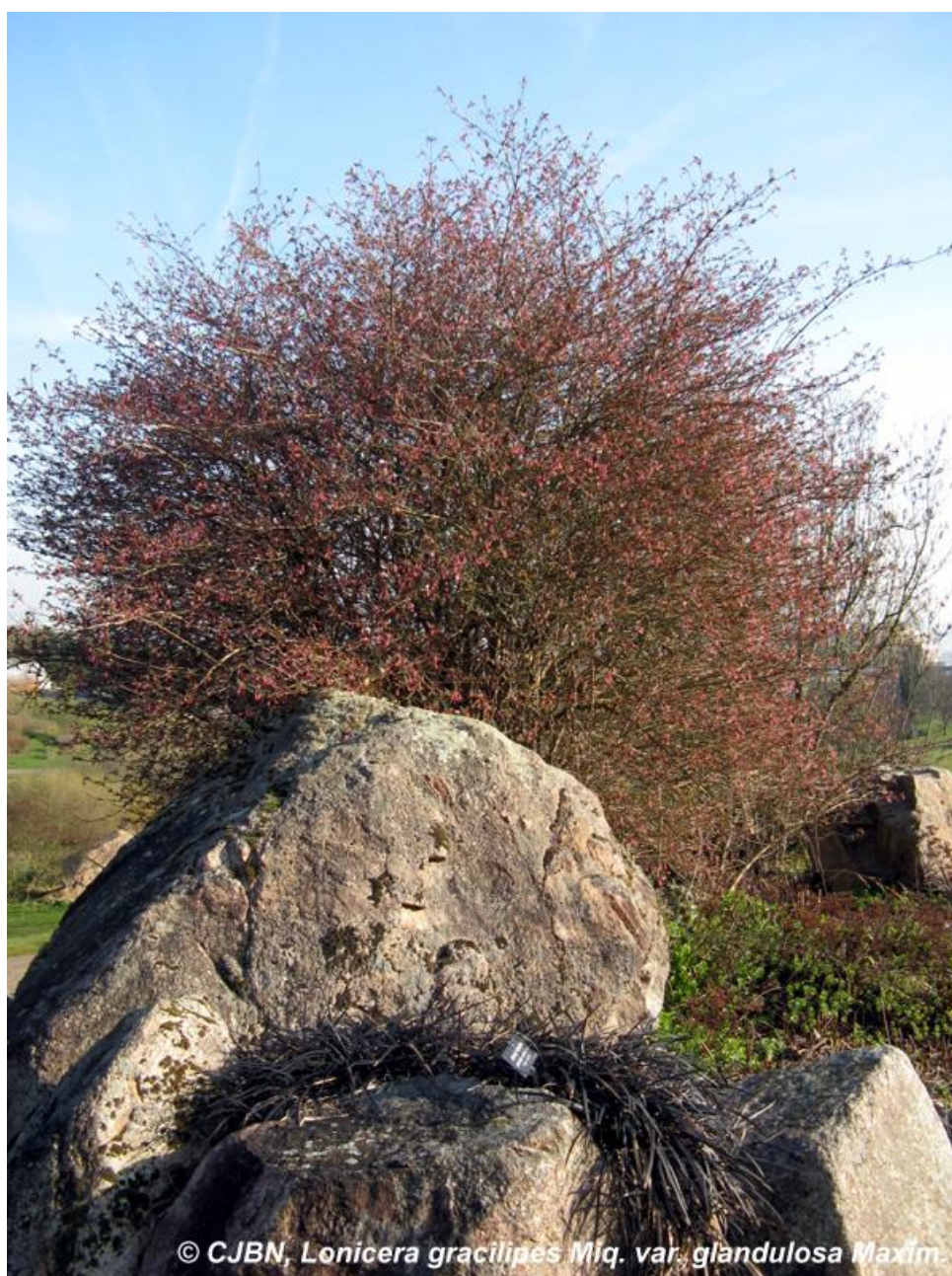
Lonicera gracilipes Miq. var. glandulosa Maxim.